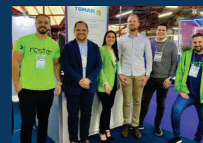
Tomasi presente em feiras e congressos do setor