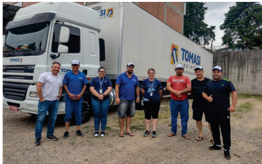
Unidade Caxias do Sul