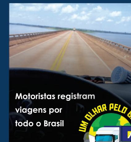
Motoristas registram viagens por todo o Brasil