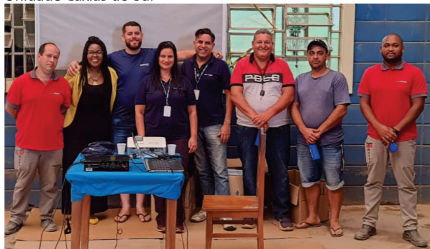
Unidade São Paulo