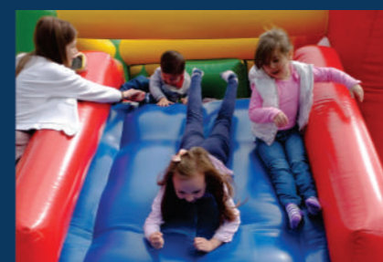
Ação comemora Dia das Crianças e Outubro Rosa